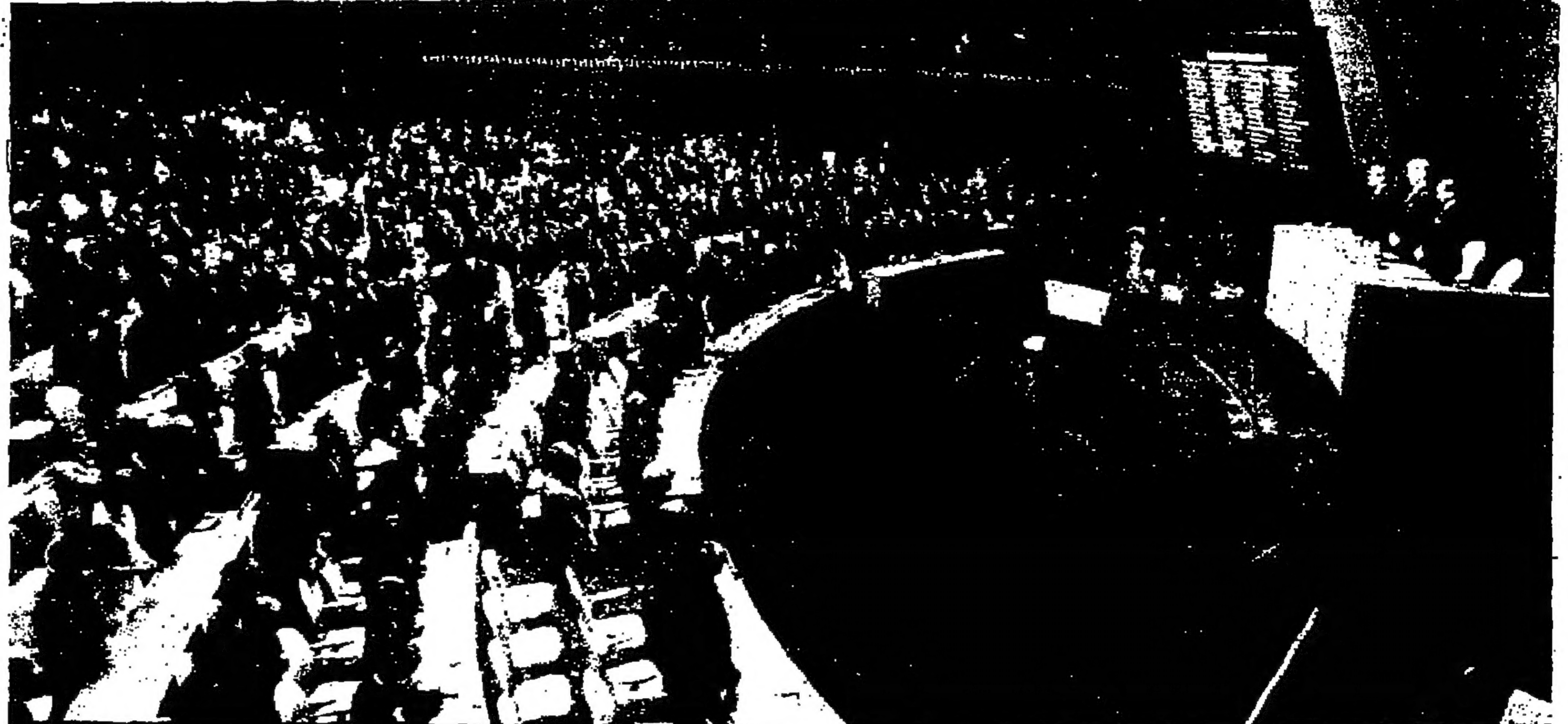
منظر عام لقاعة الجمعية العامة للأمم المتحدة لدى افتتاح دورتها وتكريم الأعضاء بصفة واحدة كرمي - صورة خاصة بالقصورين اميليو اريشاي جنوب فواصلا ورئيس الدورة - صورة خاصة بالقصورين اميليو اريشاي جنوب فواصلا

تلق إسرائيل من خطاب غروميكو تل ابيب - في تبا اركالة ابيداه الفرنسية ان المراقبين المسلمين اسرائيليين يصامون عما اذا كتبت تصريحات امير غروميكو وزير خارجية الاتحاد السوفياتي بشأن الشرق الاوسط جزء من خطة عالية تستهدف عزل اسرائيل دوليا وزيادة وتقوية الضغط الدولي عليها بهدف جعلها على الانتخاب من الرأسي العربية التي لتصلها. ويعتقد المعلقون السياسيون في اسرائيل ان خطاب غروميكو يعد جزءا من الحملة الواسعة من اجل ابعاد حل سلمي للارضية يقوم على اساس التنفيذ المرحلي لقرار مجلس الأمن.